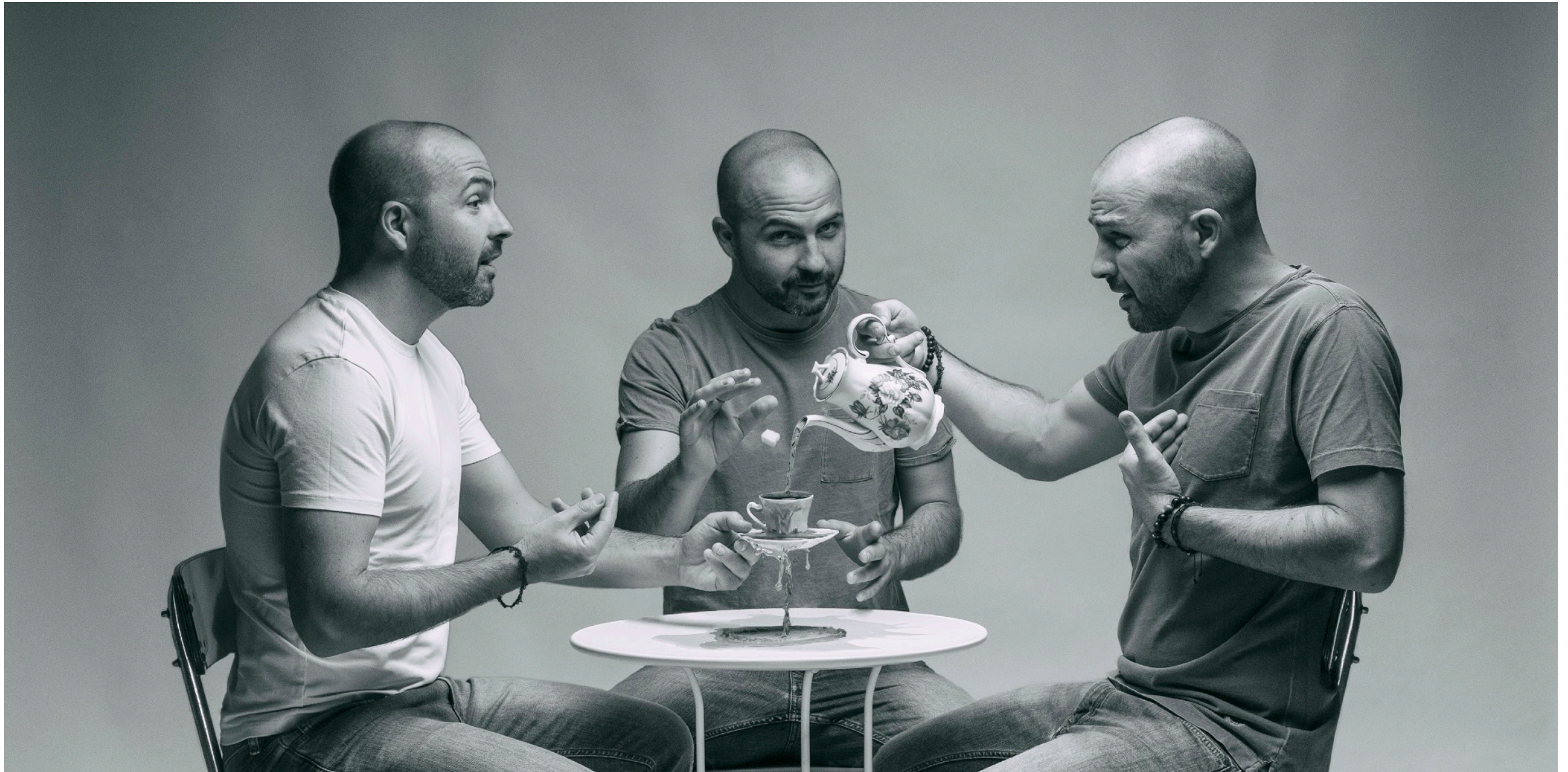
Yo, mi, me conmigo

De izquierda a derecha. Se presentan tres intensidades de tono de mas claro a mas oscuro coincidiendo con el acting de menor a mayor intensidad, una parte mas relajada sosteniendo la taza, buscando el el equilibrio y la opuesta aportando tensión, es la que sin darse cuenta no pone fin al derroche